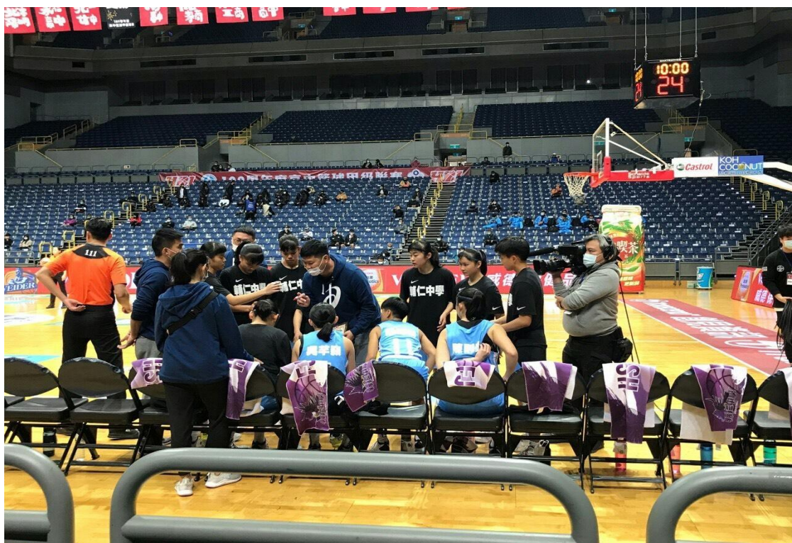
110 學年度高中甲級聯賽比賽照片↓